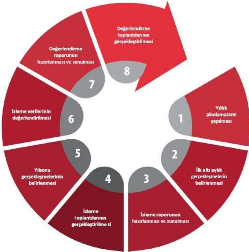
Şekil: İzleme ve Değerlendirme Süreci

İzleme ve değerlendirme sürecinin işleyişi ana hatları ile aşağıdaki şekilde özetlenmiştir: 2024–2028 Stratejik Planı'nda yer alan performans göstergelerinin gerçekleşme durumlarının tespiti yılda iki kez yapılacaktır . Ara izleme olarak nitelendirilebilecek yılın ilk altı aylık dönemini kapsayan birinci izleme kapsamında tüm amaç sorumluları, sorumlu oldukları göstergelerle ilgili gerçekleşme durumlarına ilişkin veriler “Stratejik Plan Sorumlu Müdür Yardımcısı” tarafından toplanarak performans hedeflerinin gerçekleşme durumları hakkında hazırlanan “Stratejik Plan İzleme Değerlendirme Raporu” okul müdürüne sunularak paydaşlarla paylaşılacaktır. Bu aşamada amaç; varsa öncelikle yıllık hedefler olmak üzere, hedeflere ulaşılmasının önündeki engelleri ve riskleri belirlemek ve yıllık hedeflere ulaşılmasını sağlamak üzere gerekli görülebilecek tedbirlerin alınmasıdır.